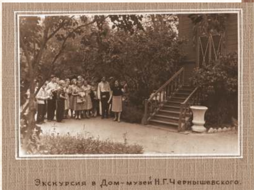
Экскурсия в Дом-музей Н.Г.Чернышевского.