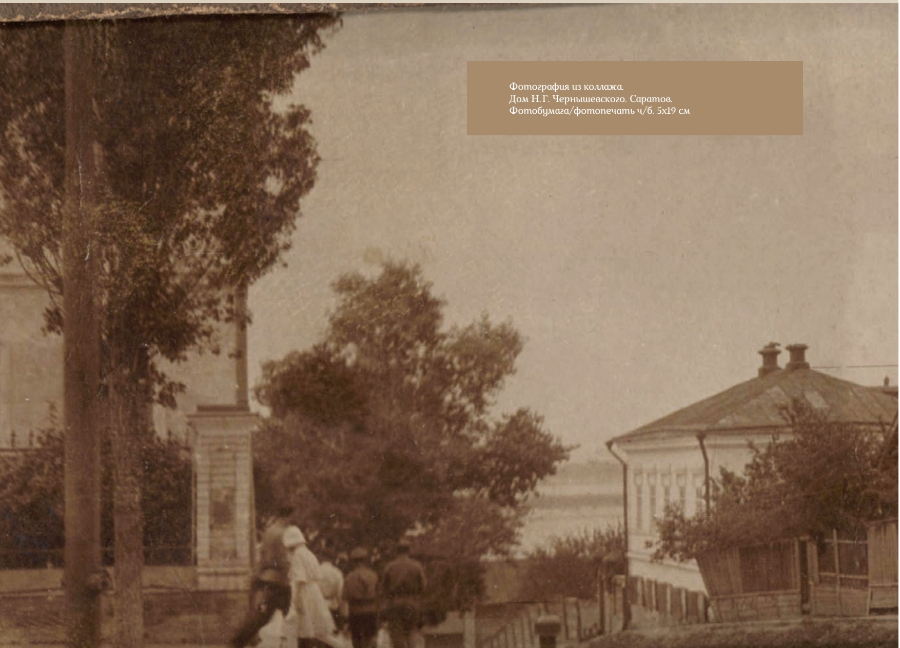
Фотография из коллажа. Дом Н.Г. Чернышевского. Саратов. Фотобумага/фотопечать ч/б. 5x19 см