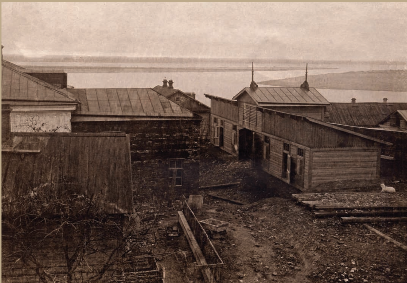
Ремонтные работы зданий Дома-музея (ныне музей-усадьба Н.Г. Чернышевского). Саратов. 1923 г. На оборотной стороне надпись карандашом: «Постройка на территории Дома-музея Н.Г. Чернышевского». Фот. М. Н. Чернышевского». 7,7x11,1 см. Фотобумага/фотопечать ч/б.