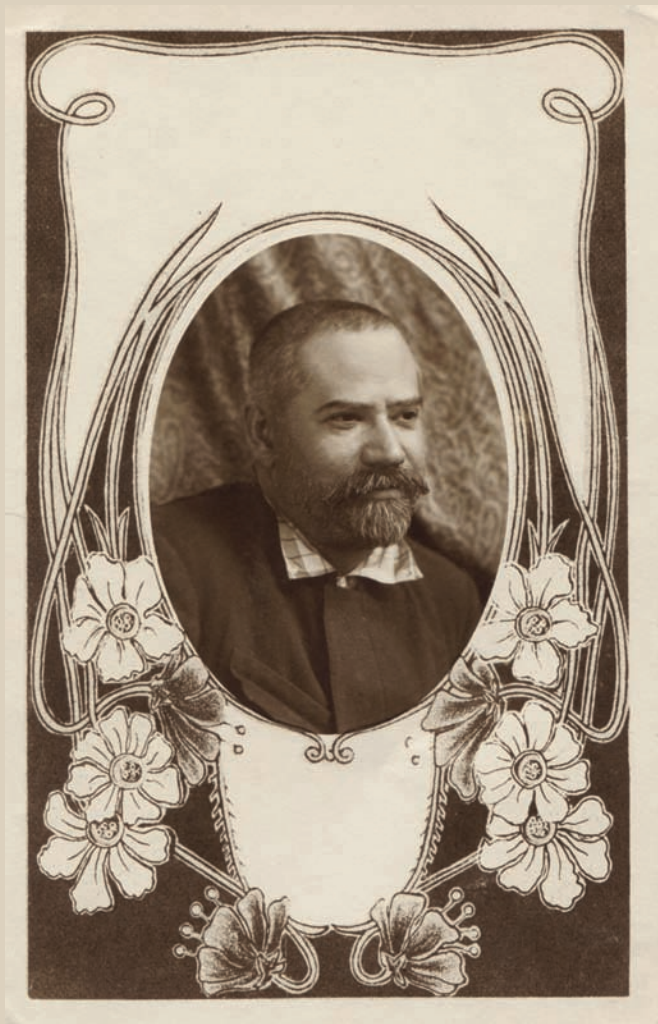
М. Н. Чернышевский. Нач. 1900-х гг. ▼ Фотобумага/фотопечать ч/б. 14,4х9,4 см