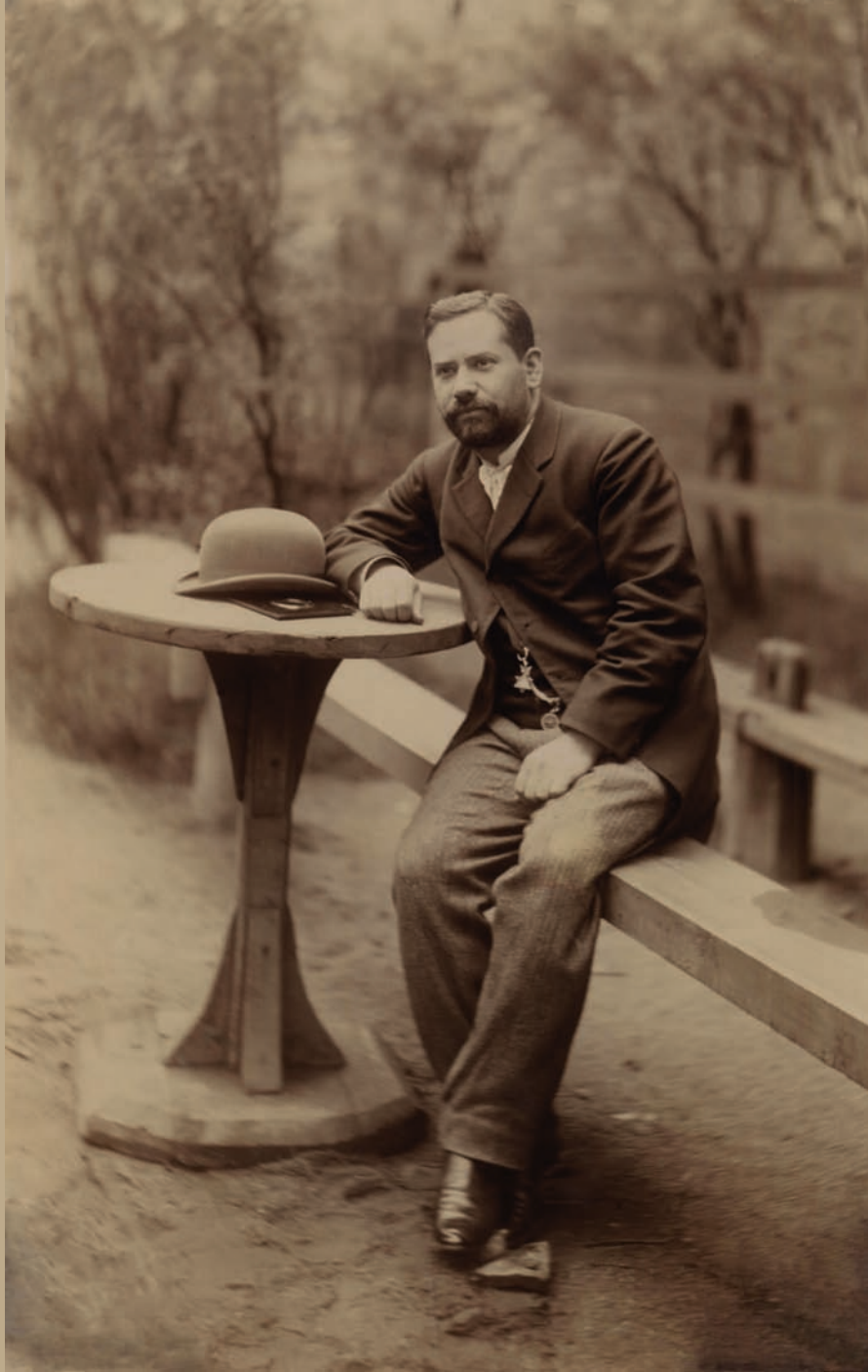
◀ Михаил Николаевич Чернышевский. Санкт-Петербург. 1890-е гг. Фотобумага/фотопечать ч/б. 19,2x12 см.