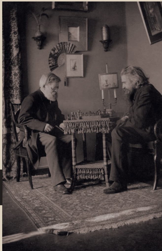
▶ Александр Николаевич Пыпин и Владимир Сергеевич Соловьев сидят за шахматами. Санкт-Петербург. 1890-е гг. Фотобумага/фотопечать ч/б. 10,6x7 см.