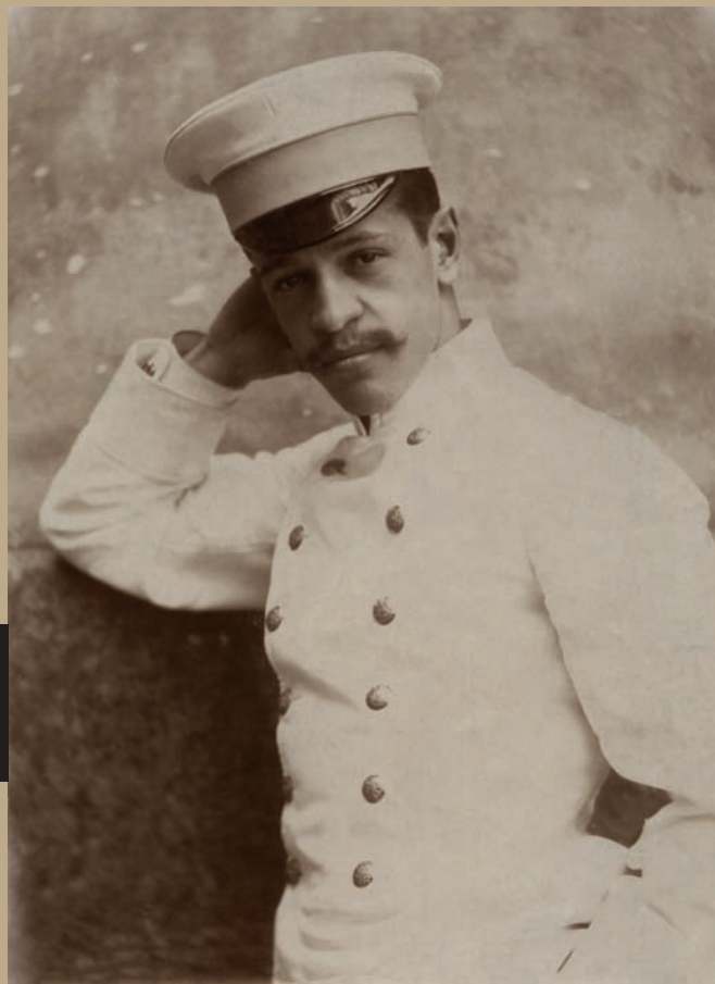
▶ Николай Александрович Пыпин. На оборотной стороне снимка надпись: «Ник. Ал. Пыпин». Санкт-Петербург. Фотобумага/фотопечать ч/б. 12,9x9,2 см.