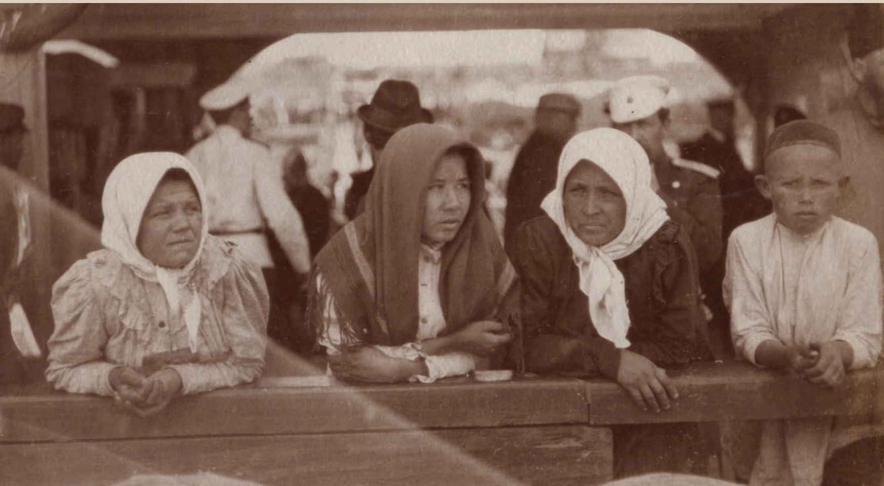
Фотография из серии «По Волге». Группа татар. Саратов. 1901 г. Фотобумага/фотопечать, сепия. 5,4x8,6 см.