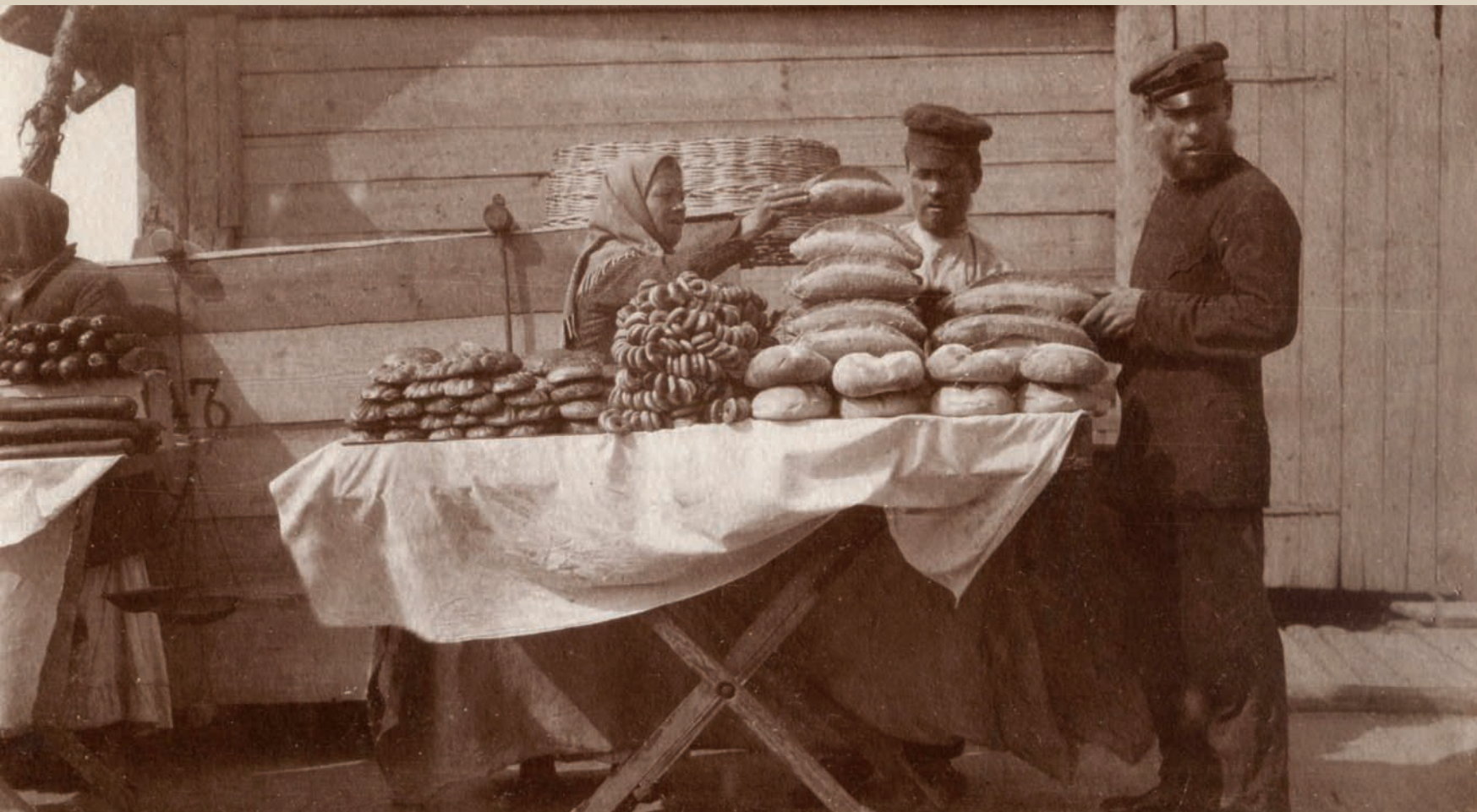
Фотография из серии «По Волге». Продажа булок на пристани. Саратов. 1901 г. Фотобумага/фотопечать, сепия. 5,6x8,7 см.