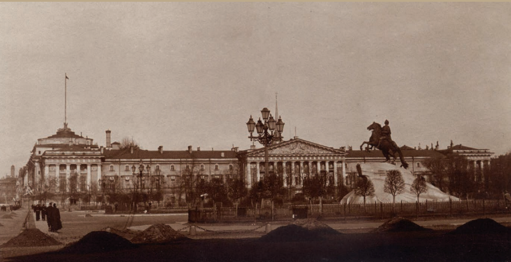
Площадь декабристов (ныне Сенатская площадь). Кон. XIX – нач. XX вв. На оборотной стороне надпись карандашом: «Виды Петербурга». Санкт-Петербург. Фотобумага/фотопечать, сепия. 5,4x10,6 см.