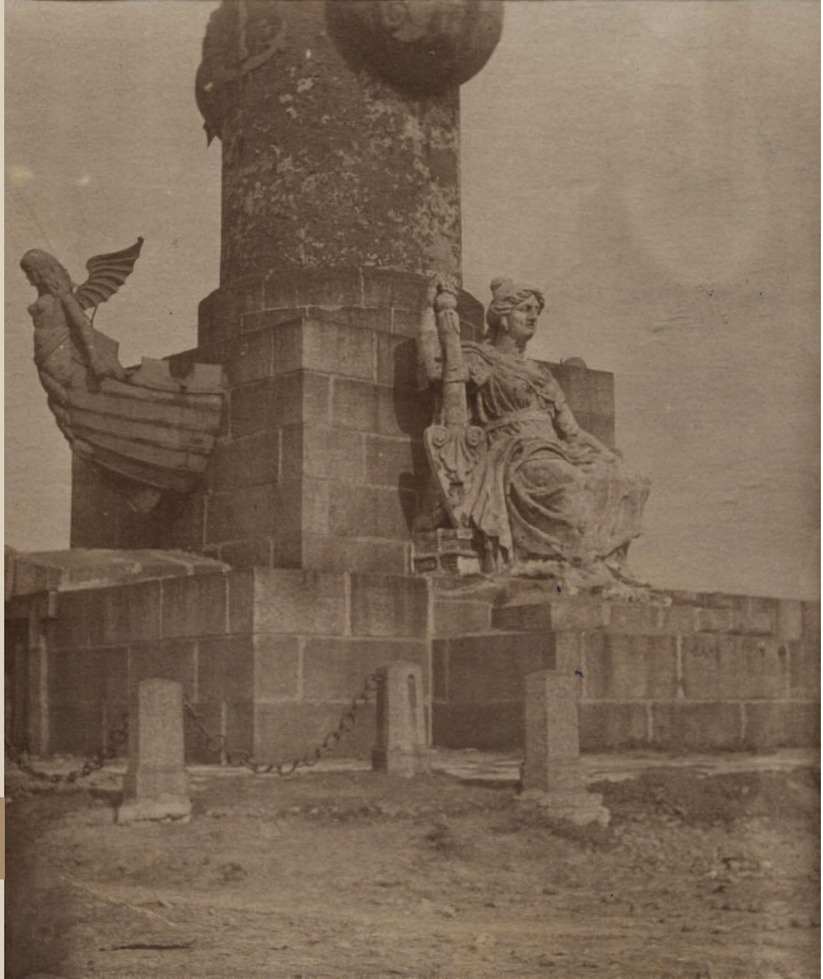
Ростральная колонна. Конец XIX века. ▶ На оборотной стороне снимка надпись карандашом: «Виды Петербурга». Фотобумага/фотопечать, сепия. 7х7,1 см.