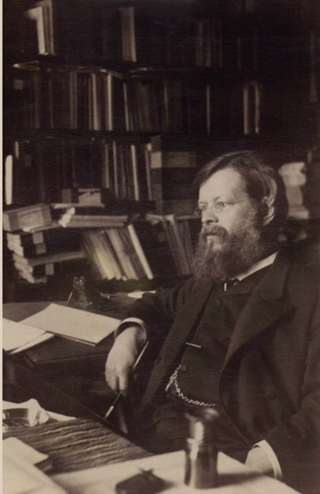
◀ Александр Николаевич Пыпин за письменным столом в своем кабинете. Санкт-Петербург. 1880-е гг. На оборотной стороне надпись карандашом рукой М. Н. Чернышевского: «Ал. Ник. Пыпин в своем кабинете». Фотобумага, картон/фотопечать ч/б. 13,4x10,3 см.