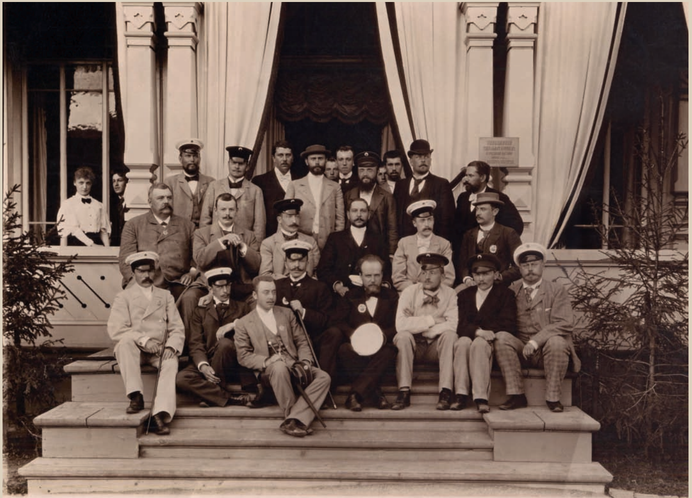
Фотогруппа участников Всероссийской выставки. Нижний Новгород. 1896 г. Фотобумага/фотопечать ч/б. 18x24 см.