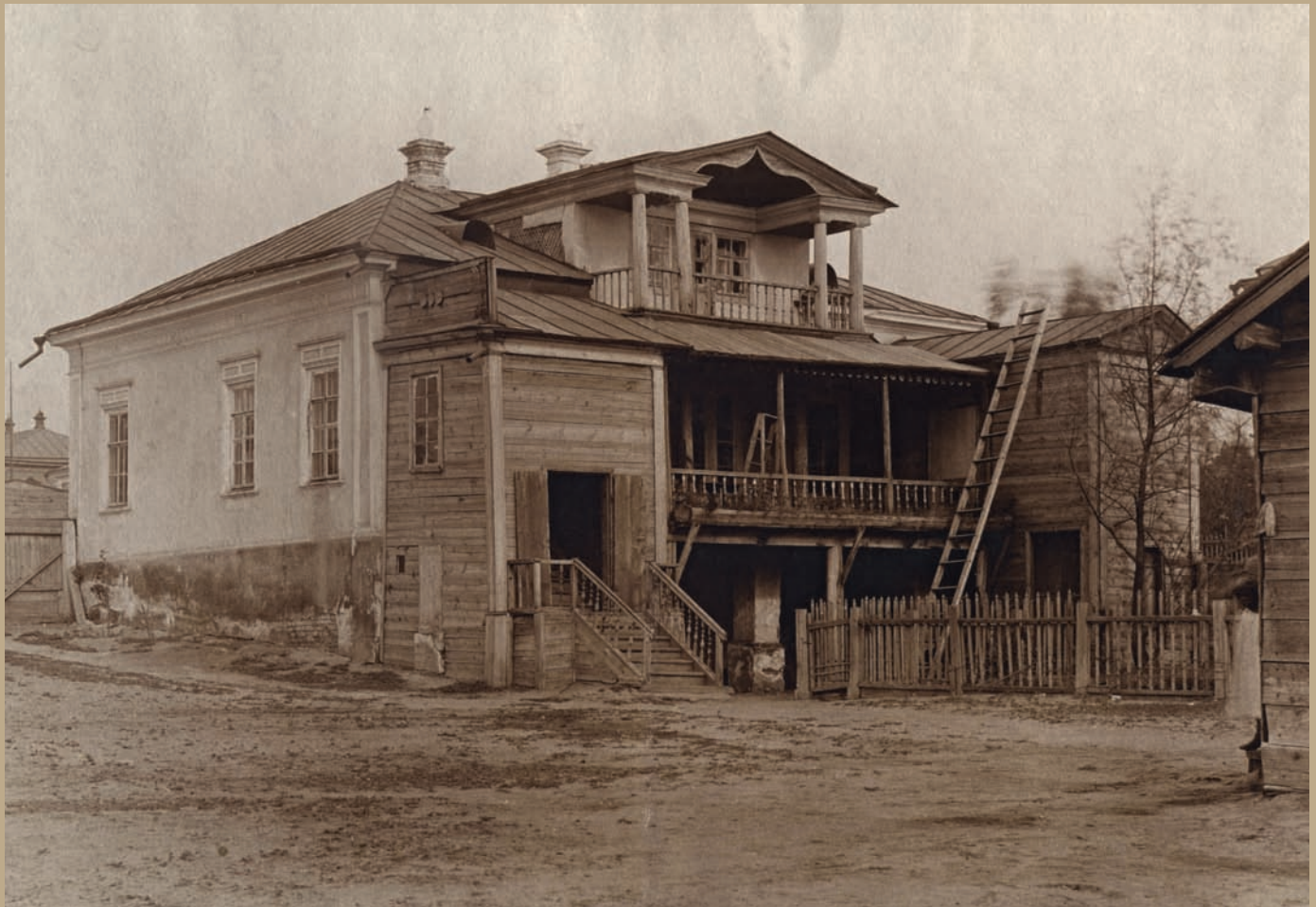
Дом Н.Г. Чернышевского со двора с палисадником. Саратов. 1901 г. Фотобумага/фотопечать ч/б. 11x16,3 см.