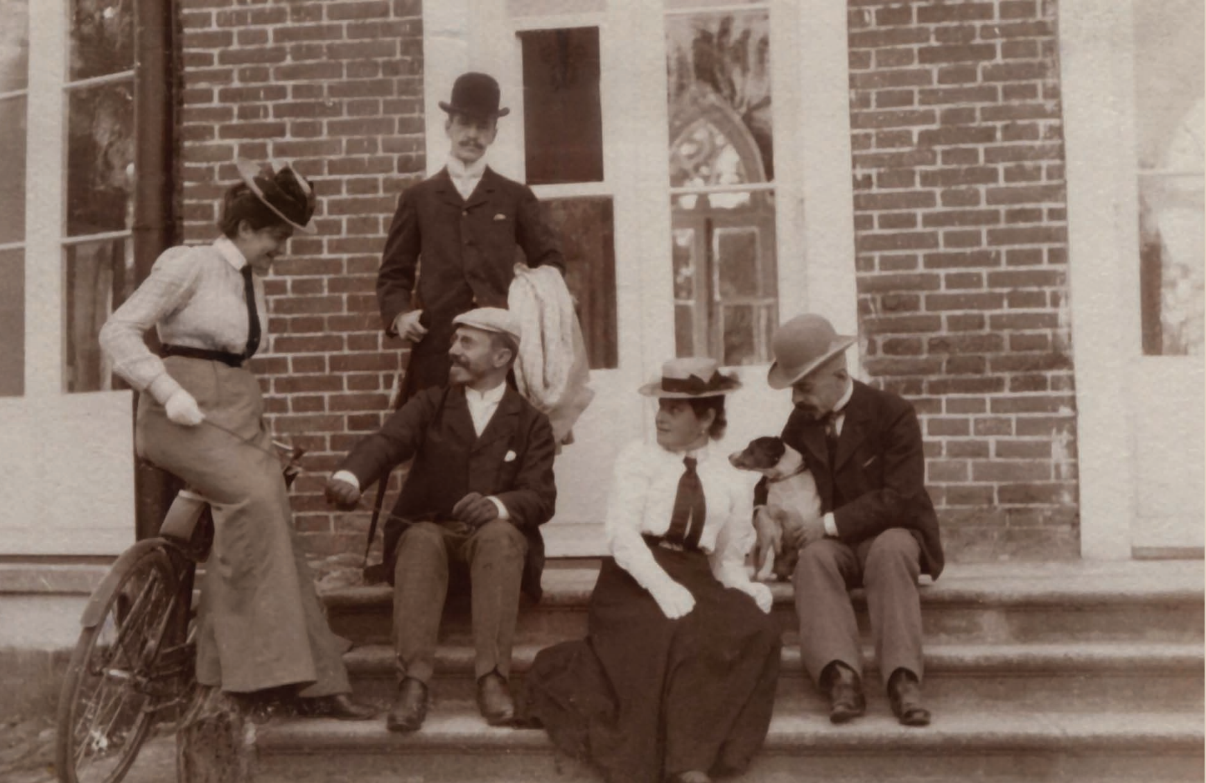
Пыпины-Ляцкие. Санкт-Петербург. 1900-е гг. Фотобумага/фотопечать ч/б. 5,6x8,7 см.