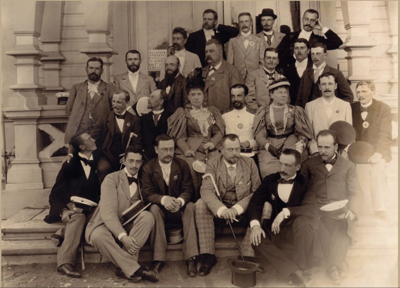
Фотогруппа лиц, снятых у входа «Станции технических испытаний, организованной императорским Русским техническим обществом». Нач. 1900-х гг. Фотобумага/фотопечать ч/б. 18,1x24 см.