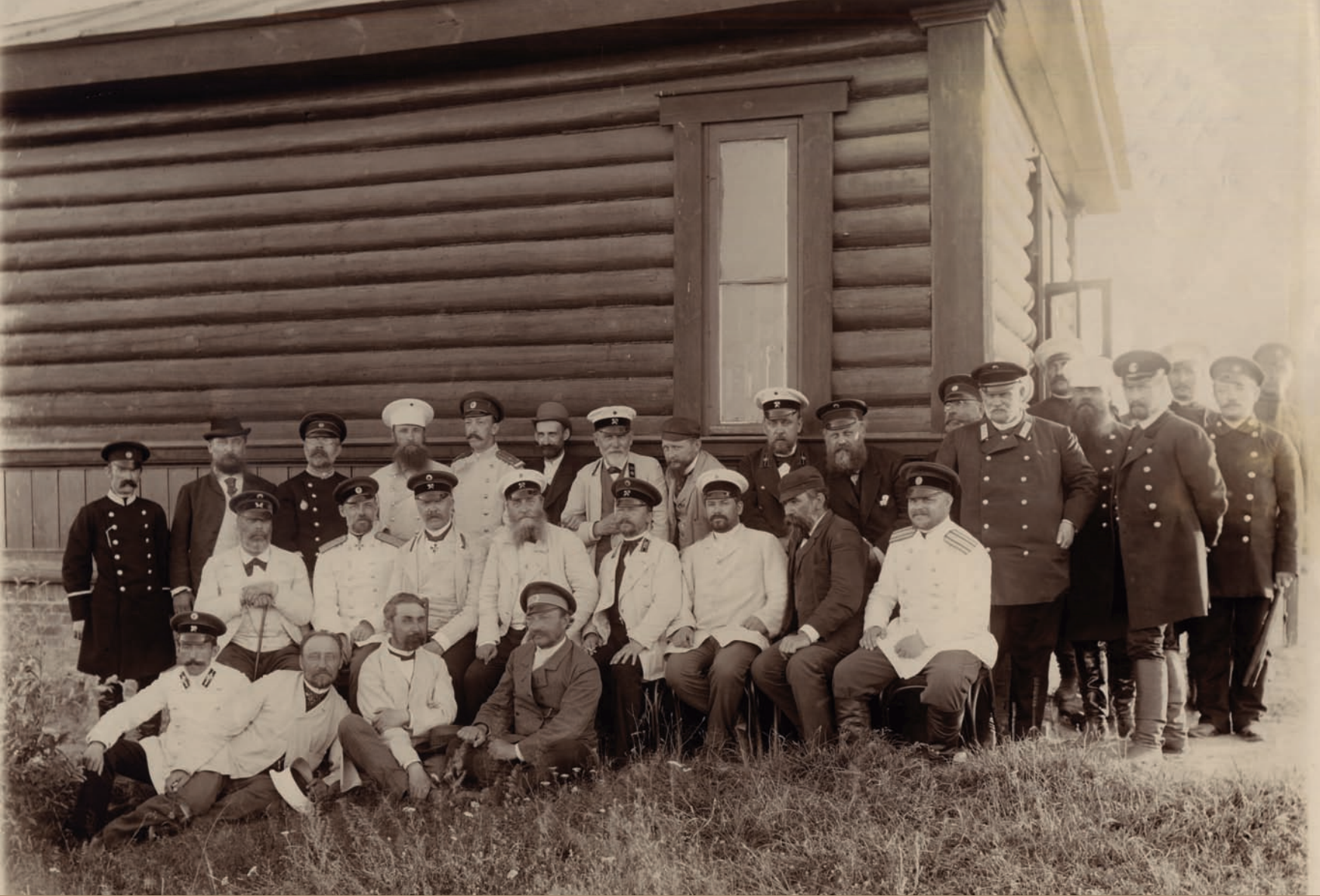
Комиссия по исследованию Московско-Брестской железной дороги. 1893 г. Фотобумага/фотопечать ч/б. 18,1x24,1 см.