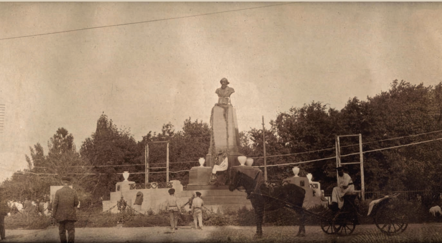
Фотография из коллажа. Памятник Н.Г. Чернышевскому перед садом «Липки». Саратов. Фотобумага/фотопечать, сепия. 5,5x10,5 см