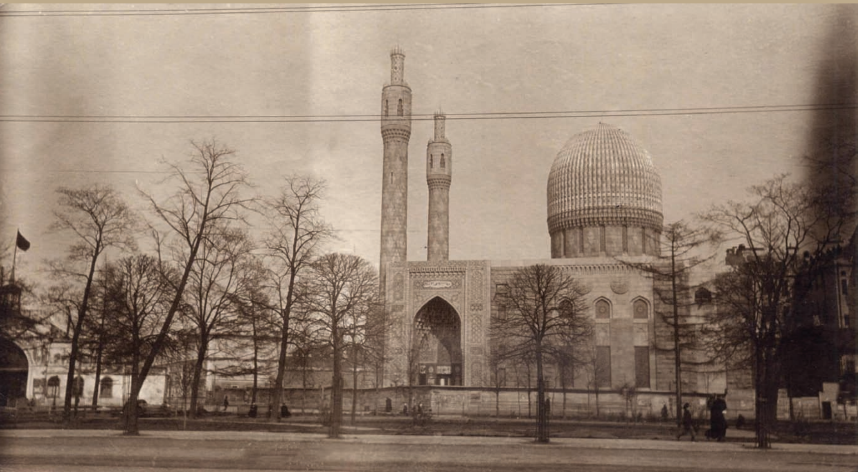
Вид Петербурга. Мечеть. Кон. XIX – нач. XX вв. Фотобумага/фотопечать, сепия. 6,4x11,2 см.