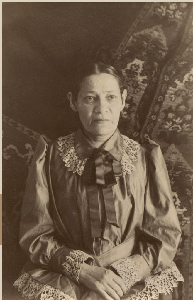
Ольга Сократовна Чернышевская. ▶ 21 апреля 1891 г. Фотобумага/фотопечать ч/б. 10,4x7 см