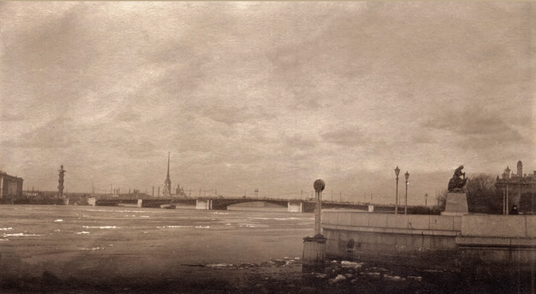
Вид Петербурга. Конец XIX века. На оборотной стороне надпись: «Виды Петербурга». Фотобумага/фотопечать, сепия. 6,3х11,1 см.