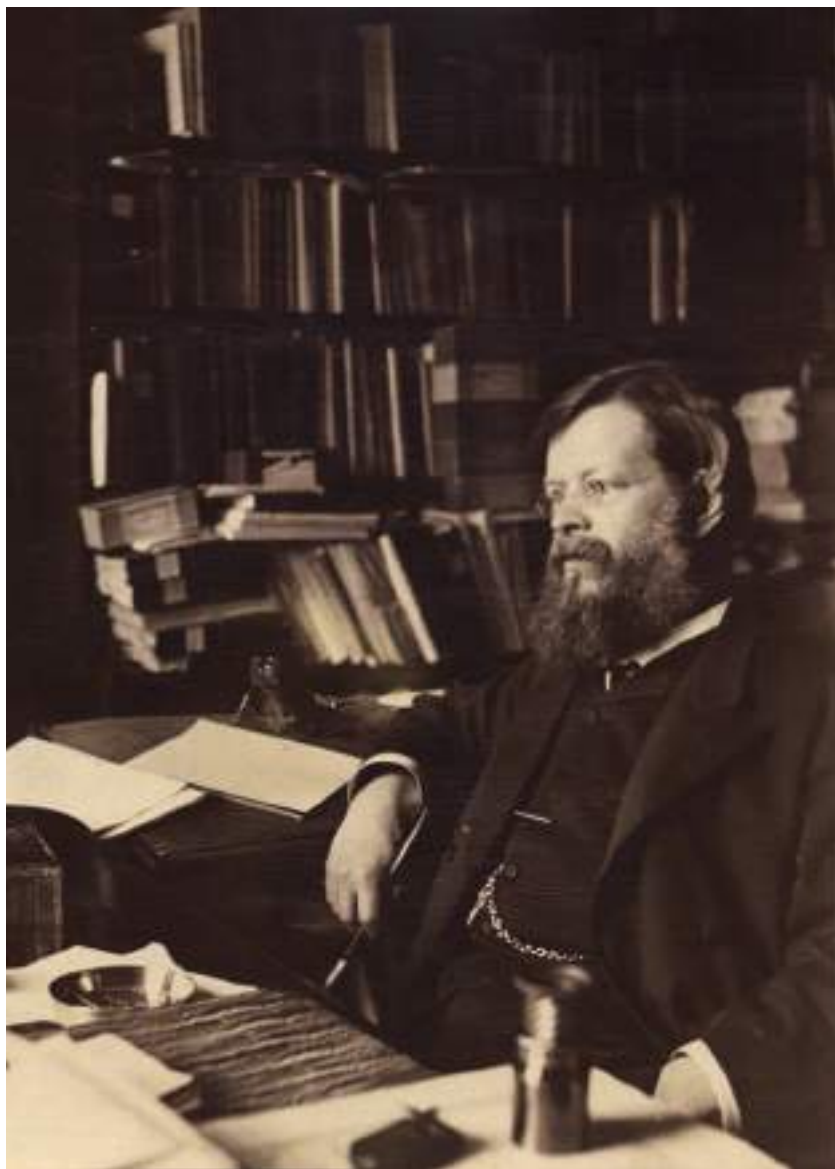
А. Н. Пыпин за письменным столом в рабочем кабинете. СПб. 1880-е гг.