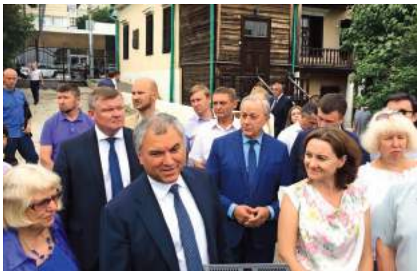
Визит В.В. Володина. 26 июня 2019 г.