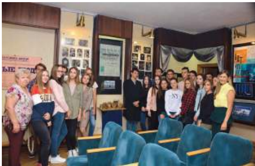
Группа экскурсантов на выставке «“Что делать?” – театральный роман». 2017 г.