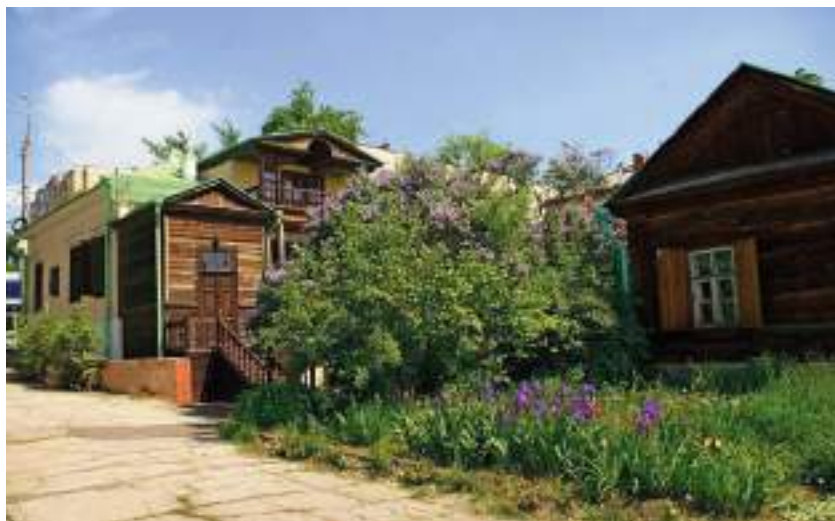
Музей-усадьба Н. Г. Чернышевского: мемориальный дом и флигель О. С. Чернышевской. Фото. В. Шараев 2019 г.