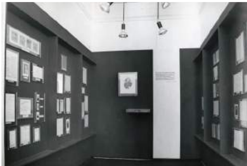
Фрагмент выставки «Н. Г. Чернышевский – революционный демократ, писатель, ученый». 1978 г.